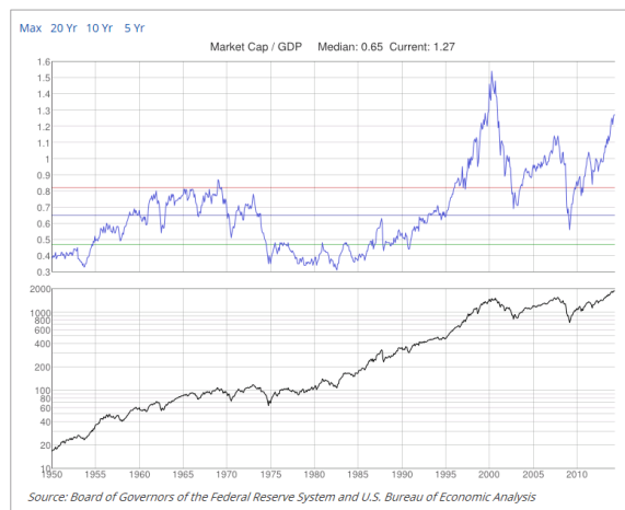
Abbildung 2: Marktkapitalisierung im Verhältnis zum BIP.

Was bedeutet das konkret? Sollten die politischen und geldpolitischen Kräfte der westlichen Industriestaaten nicht endlich in glaubwürdiger Manier Garn auf den Webstuhl aufzuspannen wissen, droht die Enttarnung des Gelddruckwahnsinns, was wiederum zu einer Neubewertung der hohen Aktienpreise bei tiefen Dividendenrenditen führen wird.